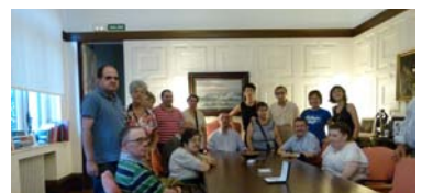
Visita a la delegación del Gobierno