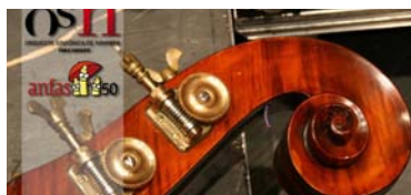
Concierto de la Orquesta Sinfónica