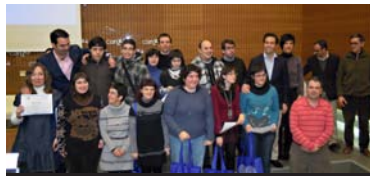
Concurso Miradas a Europa