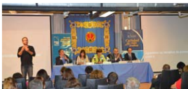
Jornada "Ciudadanos de Pleno Derecho"