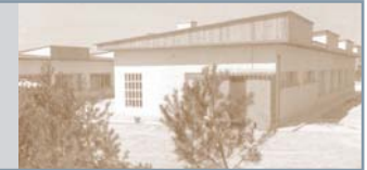
IMAGEN DE ANFAS

El tercer centro de Educación Especial se crea en Tudela