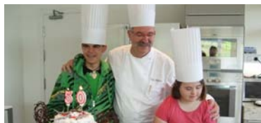
Campaña de voluntariado