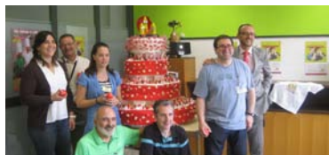
Las zonas celebran el 50 aniversario