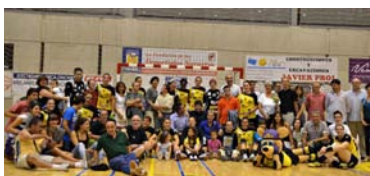
Partido de presentación del Itxako