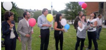
125 caminos para la autodeterminación