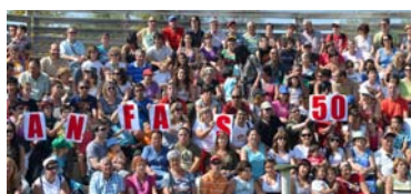
Fiesta en Senda Viva