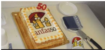
ANFAS cumple 50 años