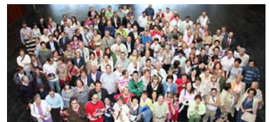
Asamblea y fiesta de 50 aniversario