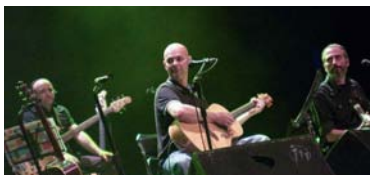
Concierto de Celtas Cortos