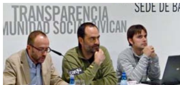
Foro de Innovación Social