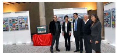
Exposición itinerante de ANFAS