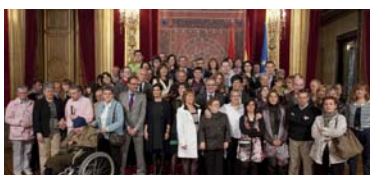
Recepción en el Gobierno de Navarra